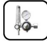
رگولاتور و هیتر گاز Regulator and gas heater