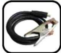
کابل جوشکاری با گیره اتصال به قطعه کار Welding cable including earth clamp