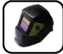
ماسک الکترونیک Electronic mask