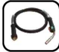
تورچ هواخنک Air cooled Torch