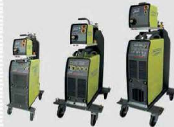
TIG DC,AC/DC (Inverter)