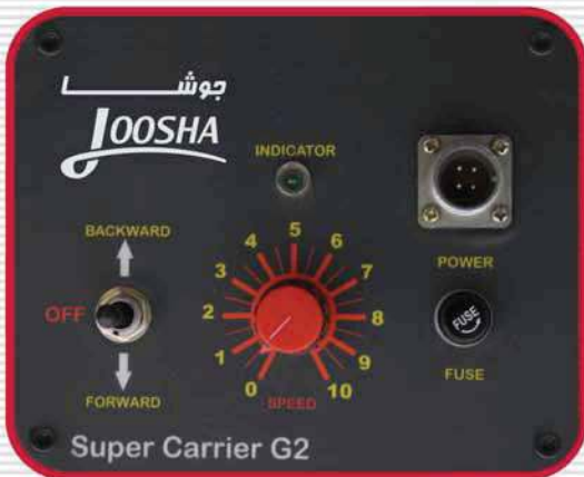
Super Carrier G2