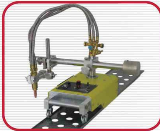
Gas Cutting Machine (G1)