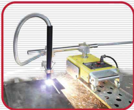
Plasma Cutting Machine (P1)

All clamps have a very robust and reliable construction and