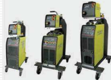
TIG DC,AC/DC (Inverter)