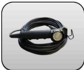
ریموت کنترل Remote Control