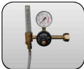
رگولاتور گاز Gas regulator