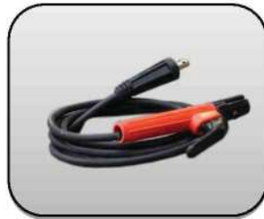
انبر جوش به همراه کابل آن Electrode holder with cable