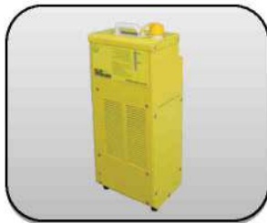
یونیت آب خنک Cooling unit