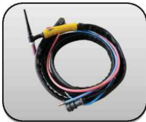
تورچ هوا خنک یا آب خنک Air cooled or water cooled Torch