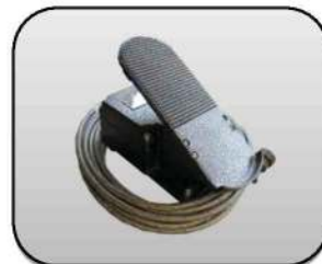
پدال پایی Foot pedal