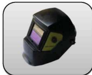
ماسک اتومات جوشکاری Automatic welding helmet