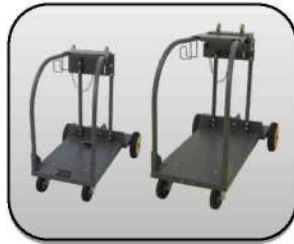
حمل کننده مدل "BT" یا "S" Carriage type "BT" or "S"