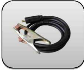
کابل جوشکاری با گیره اتصال به قطعه کار Welding cable including earth clamp